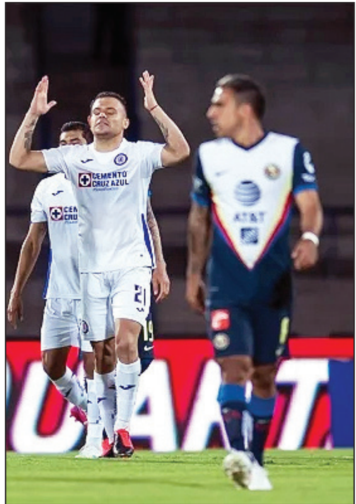
Mientras no haya una vacuna, el coronavirus no va a desaparecer ¿a dónde se va?

Bueno, pues lo que recomendó el secretario de la Organización Mundial de la Salud, el griego, Tedros Adhanom: “pruebas, pruebas, pruebas”. Las directivas tendrán que