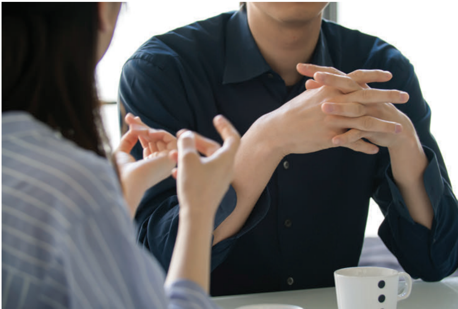
Cofide empresa especializada en la capacitación empresarial considera que actualmente las relaciones laborales dentro de una organización pública y privada, son la llave para alcanzar las metas de crecimiento.