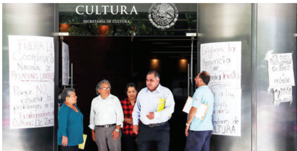
Integrantes del Sindicato Nacional de Trabajadores de la Secretaría de Cultura.

mente desaparecerán ya que la SHCP considera que no se fundamenta su pago y en el entorno de austeridad no hay recursos suficientes para pagarlas.