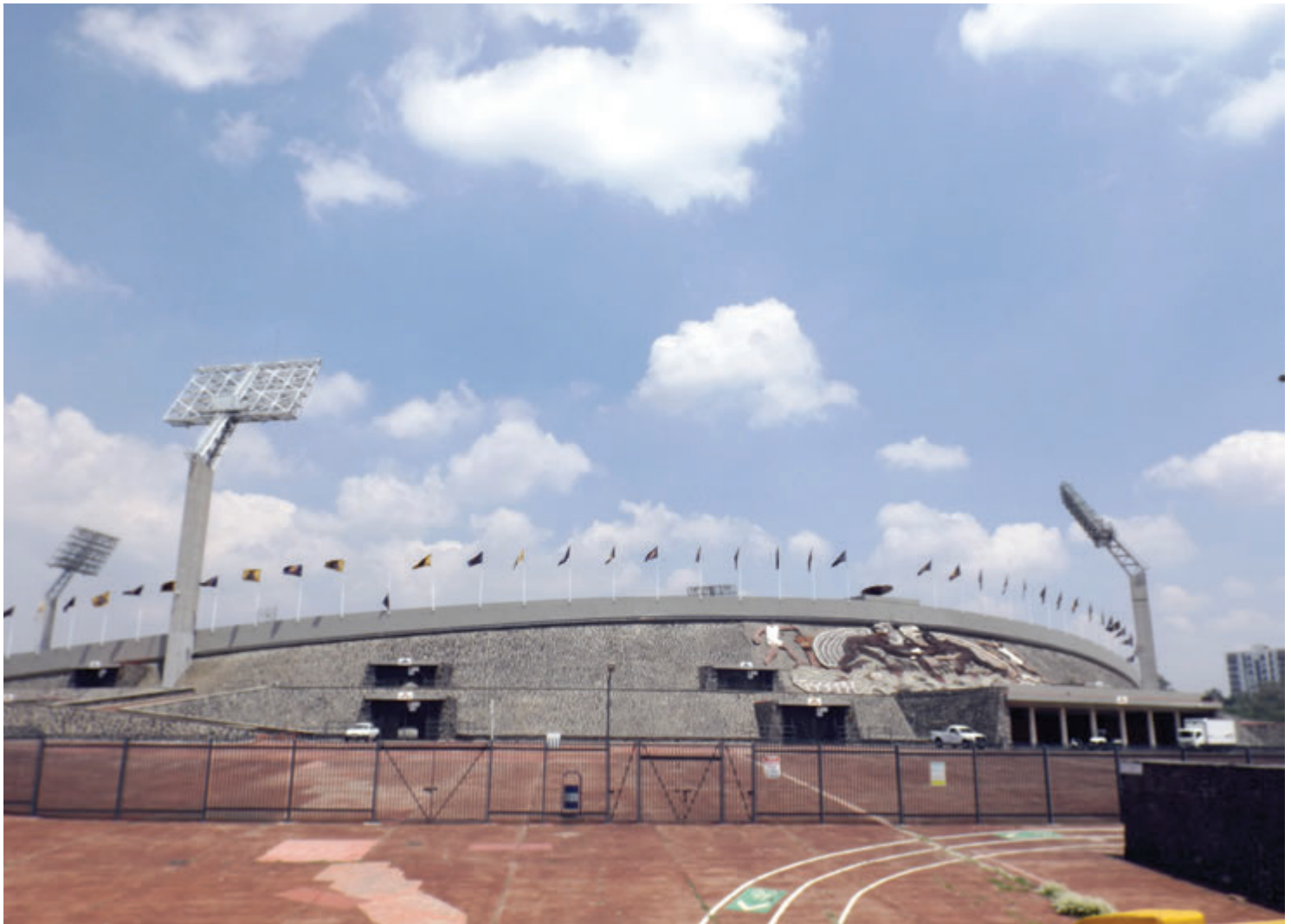
Finalmente se decidió entre dueños y presidentes de la Liga que tendrá lugar el calendario de juegos para la temporada 2020 que incluía las series interzonas que consta de 48 juegos por equipo.