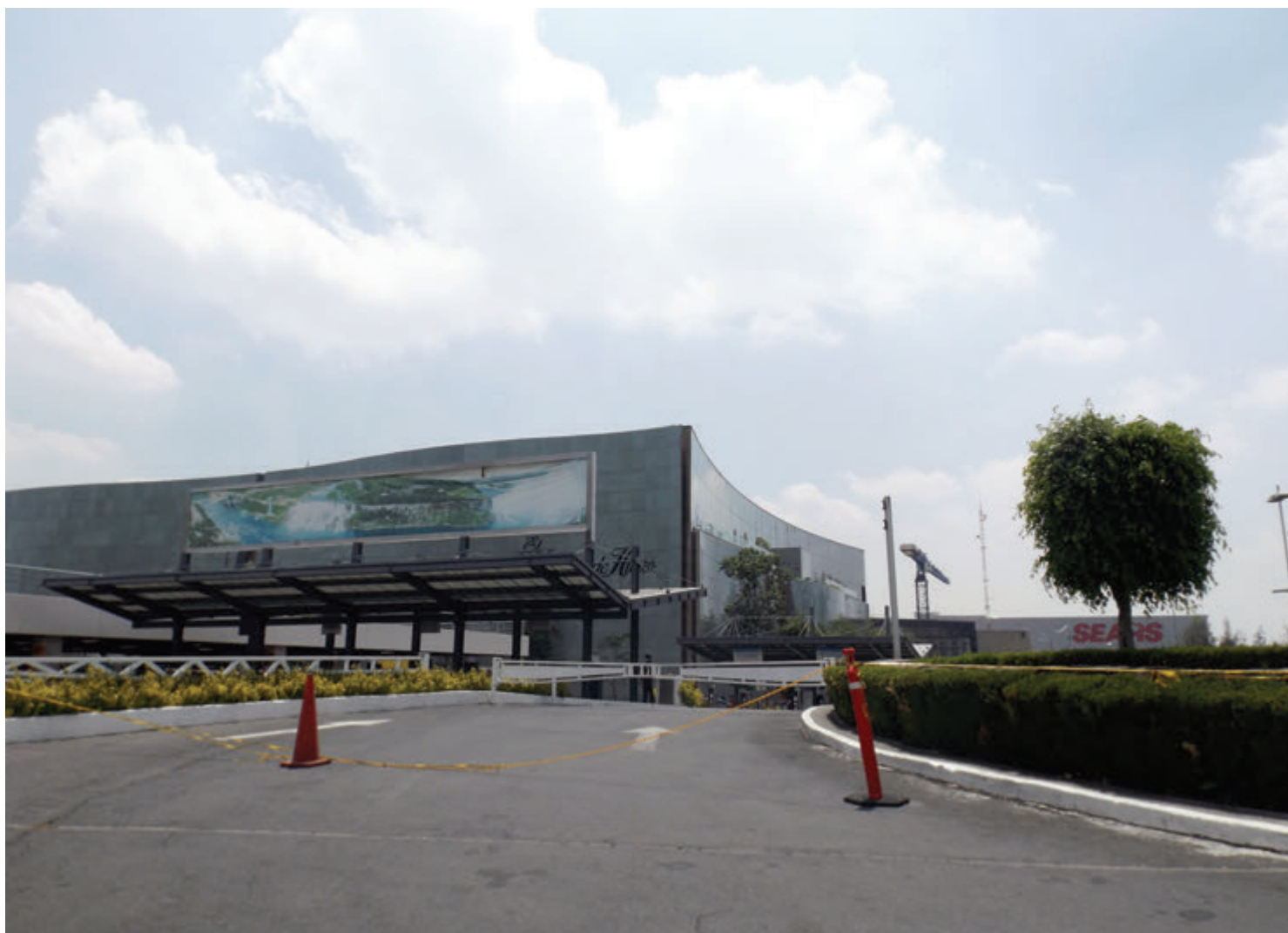
Las consecuencias para los ingresos por el trabajo y los trabajadores impactan porque la oferta de mano de obra está disminuyendo como consecuencia de las medidas de cuarentena y la reducción de la actividad económica.

asistencia de más de 200 mil personas. Los asistentes generalmente son de casi todo el país.