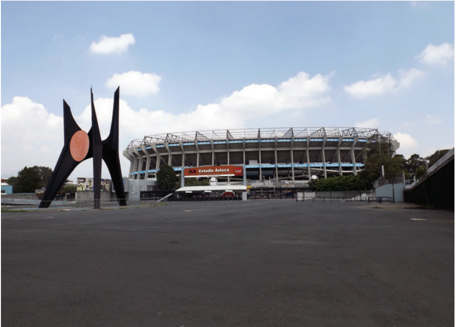
Taquiller@s, que viven la inactividad al no expendirse boletos para presencias los partidos. Colateralmente la afectación se refleja al interior en acomodadores, gente que alquila cojines, quienes venden botanas, cervezas y refrescos y accesorios como cornetas, banderines y demás artículos.

medianas y pequeñas empresas emplean para reducir costos.