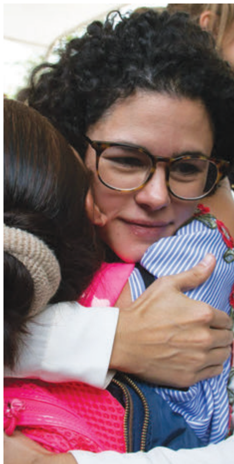
En conmemoración del Día Internacional de las Trabajadoras del Hogar. Se llevó a cabo en la explanada del Hospital de Especialidades del Centro Médico Nacional Siglo XXI.

“México ya ha emprendido acciones para mejorar las condiciones laborales de las 2.4 millones de personas trabajadoras del hogar, a través de la reciente reforma a la Ley Federal del Trabajo